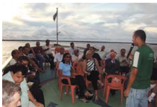
Associados escutam, atentos, as explicações do guia durante passeio de barco pelos rios Guajará e Guamar, em Belém.