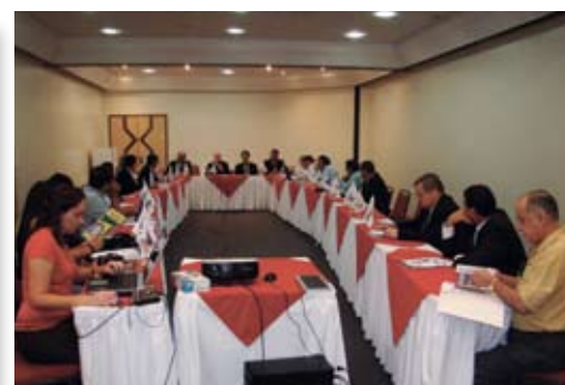
Conselho Deliberativo se reúne em Belém para discutir assuntos de interesse da classe e eleger Presidente e Diretoria da Febrafite.