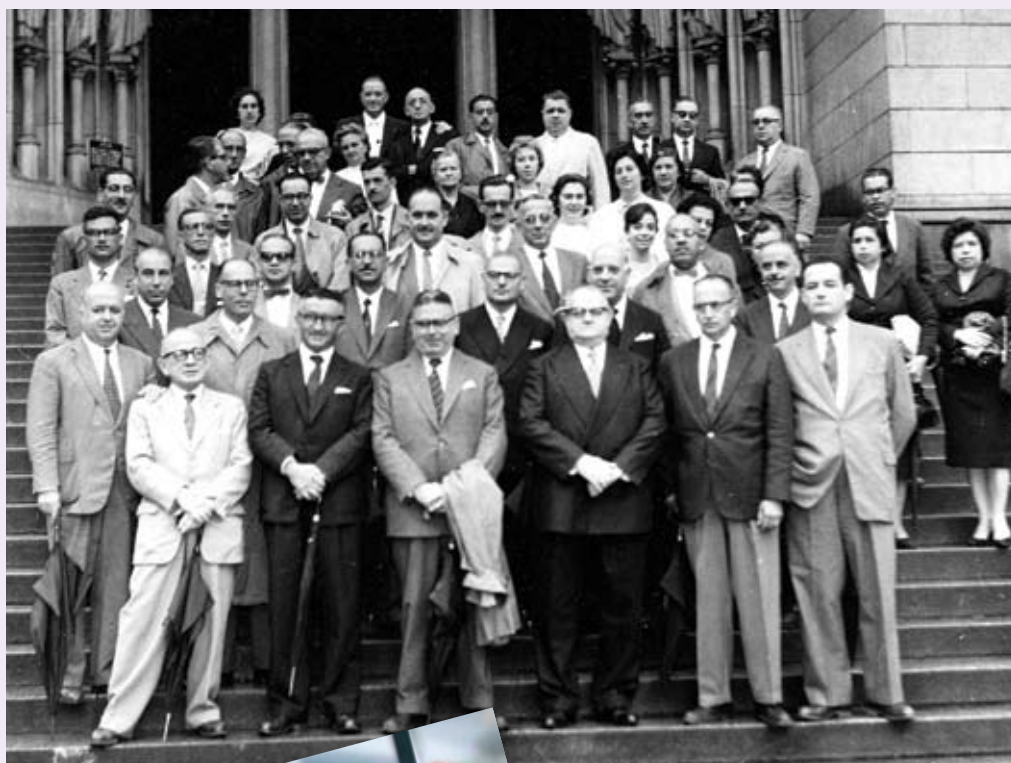
Acima, os AFRs fundadores da Afresp, em 1948.

Para consultar basta acessar: www.afresp60anos.org.br .