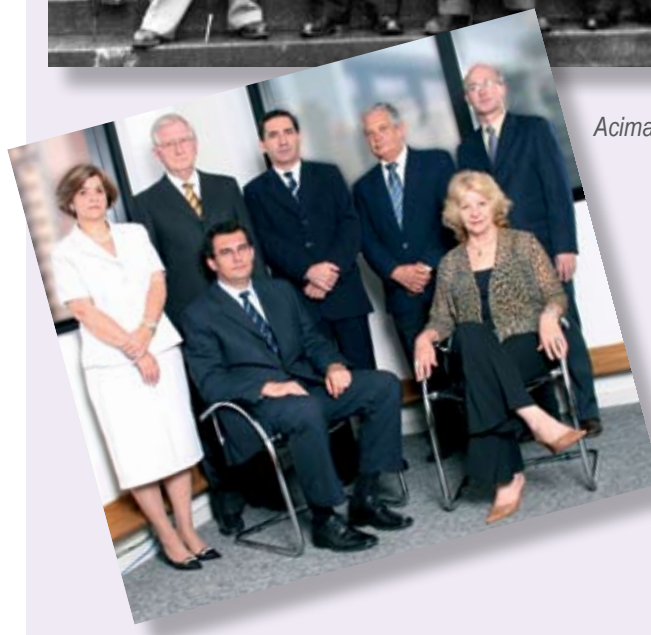
Ao lado, a atual diretoria da Afresp (2006-2008)