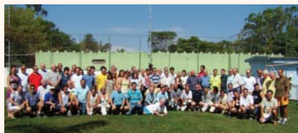
Foto oficial: descontração e confraternização entre os associados, que desfrutaram de muito lazer em proximidade com a natureza.