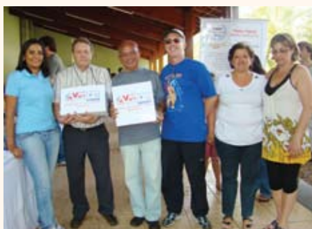
A entrega dos prêmios aos sortudos do dia.