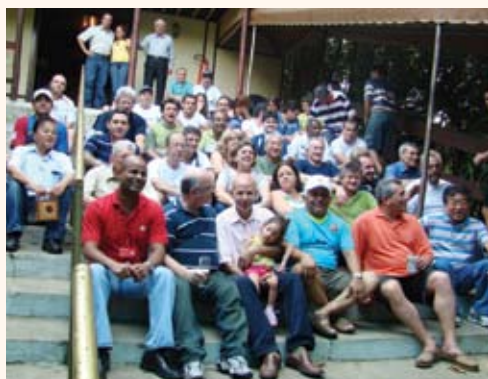
Fiscais se reúnem para a foto oficial do grupo.