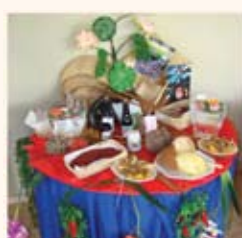
Frutas típicas, animais e índios foram muito bem representados na festa.