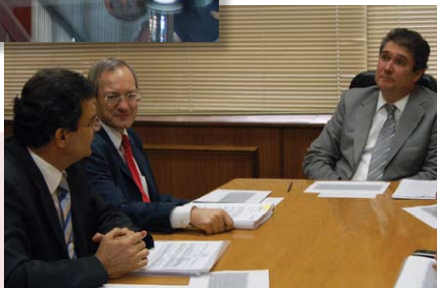
Representantes da classe reúnem-se na Assembléia Legislativa para discussão e aprovação do projeto, que posteriormente tornou-se Lei, e que reestrutura a carreira dos Agentes Fiscais de Rendas do Estado de São Paulo.